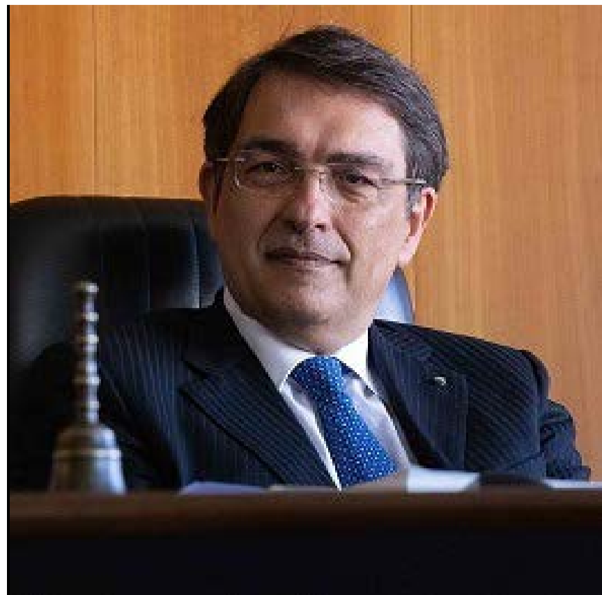
Giacomo Lasorella, presidente dell'Agcom

ruolo svolto dagli otto Comitati Regionali per le Comunicazioni che hanno implementato l'Atto di indirizzo in materia di percorsi formativi di cittadinanza digitale, promosso dalla Autorità attraverso percorsi specifici per il conseguimento del cosiddetto Patente