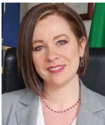
I commissari dell'Agcom Laura Aria, Massimiliano Capitanio, Antonello Giacomelli ed Elisa Giomi

lo sviluppo del senso critico dei cittadini e il rafforzamento dei valori democratici e, anche per tale motivo, sta assumendo una sempre maggiore centralità nelle politiche dei media a livello europeo e nazionale.